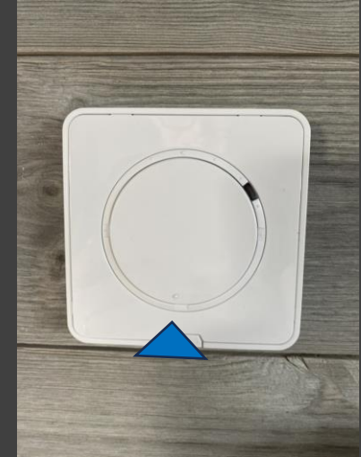
KI 6 – Värmen avstängd i rummet