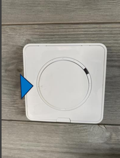
KI 9 – Låg värme