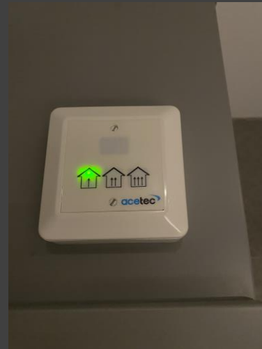
Ventilationen regleras i badrummet