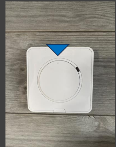
KI 12 – Normal värme