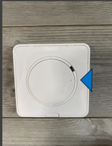
KI 3 – högsta värme